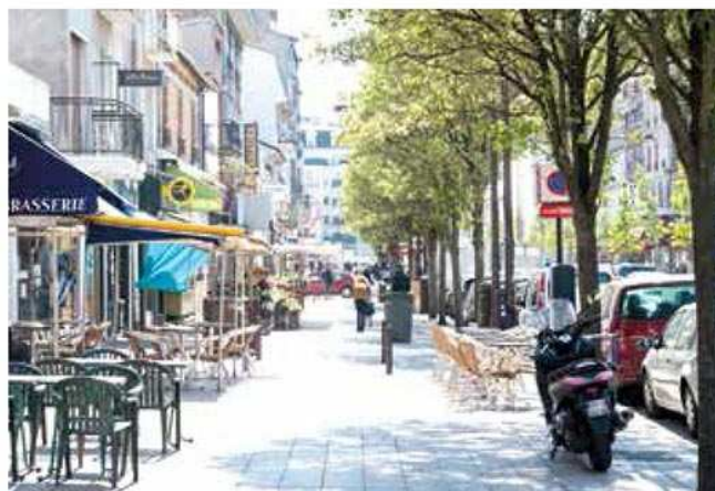
Assurer des liaisons douces.