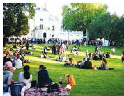
Aménager le quotidien.

outils ayant fait l'objet de concertation avec les habitants, les représentants des commerçants sédentaires et ambulants, les chambres consulaires et les associations. Il y a donc les nouveaux arrêtés d'occupation du domaine public à des fins de commerce et deux règlements, celui régissant les publicités et les enseignes et celui des marchés forains. Ils sont le fruit des rencontres régulières organisées depuis deux ans avec les parties prenantes, mais aussi des conférences thématiques tenues pour sensibiliser chacun aux enjeux, et des informations pédagogiques diffusées par la municipalité afin d'appeler les acteurs économiques et les habitants, à contribuer activement à la démarche de valorisation de la ville et de son tissu social, économique et culturel. Ce sont les leviers d'une gestion de l'espace public qui refuse d'installer des activités commerciales irrespectueuses, voire perturbatrices, tout ce qui contribuerait à créer une image dégradée de la ville, comme des terrasses et des étalages médiocres occupant sans autorisation l'espace public, ou produisant des nuisances pour les habitants et pour l'activité commerciale collective.