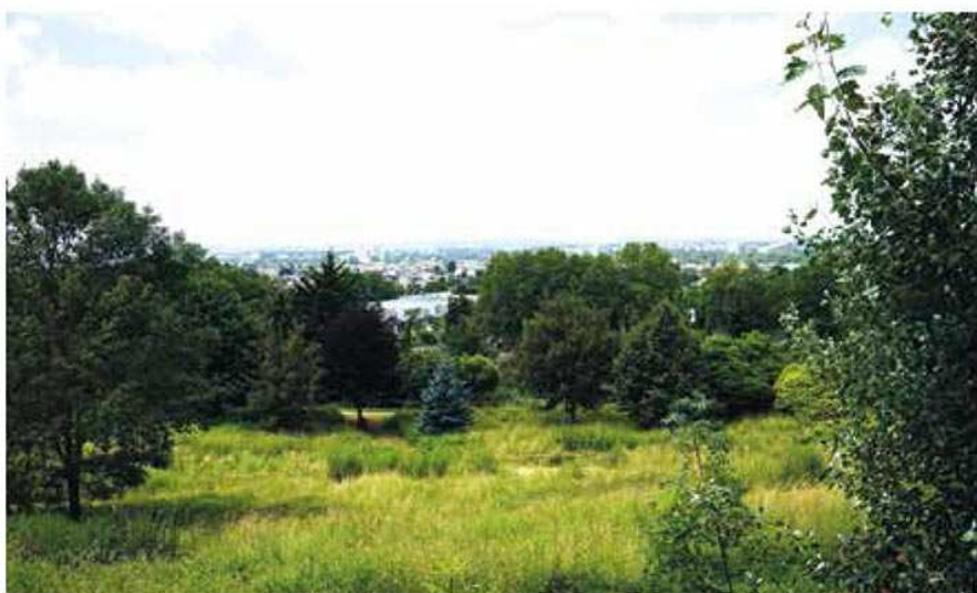
Préserver le patrimoine naturel.

En réfléchissant à l'organisation de trois pôles qualité, les deux villes se sont mises d'accord pour exercer une pression sur les abonnés du marché et sur son gestionnaire. La feuille de route établie postule donc à hausser le niveau de la professionnalisation des commerçants, afin qu'ils mettent en œuvre des actions concrètes en vue de respecter propreté, sécurité et diversité des produits, notamment dans l'alimentaire. C'est ainsi que les nouveaux règlements ont été conjointement réfléchis en regard des besoins de qualité exigés par les deux villes.