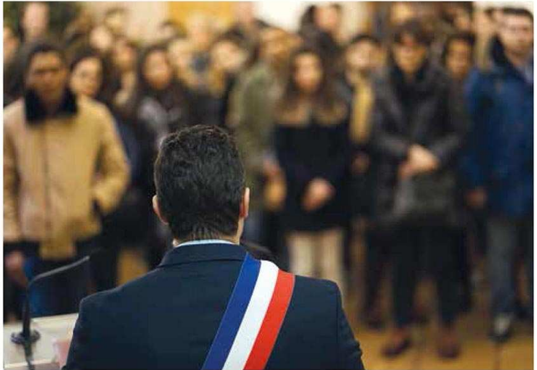
Cérémonie d'accueil des jeunes citoyens à la mairie.

zones habitables sont réservées aux pavillons. Couplé à environnement de 80 hectares d'espaces verts, nous disposons-là d'un atout d'importance, l'occasion de devenir un des poumons verts de l'Est parisien, un lieu où il fait bon vivre. Imaginez ce qu'il est possible d'envisager comme espace de loisirs en partant du parc forestier de la Poudrerie, pour aller jusqu'aux coteaux d'Aulnay-sous-Bois avant de redescendre vers Gagny et Villemomble ? Tout en restant à proximité de Paris. N'oublions pas que Livry-Gargan occupe une position de pivot dans la zone, à la sortie de la Seine-Saint-Denis et à l'entrée de la Seine-et-Marne, et à deux pas de Roissy. Avec le Grand Paris Express et le nouveau maillage des transports mis en place, nous serons à 25 minutes de la Défense. Pas mal, non ?