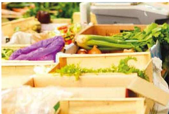
Sélectionner les commerces.