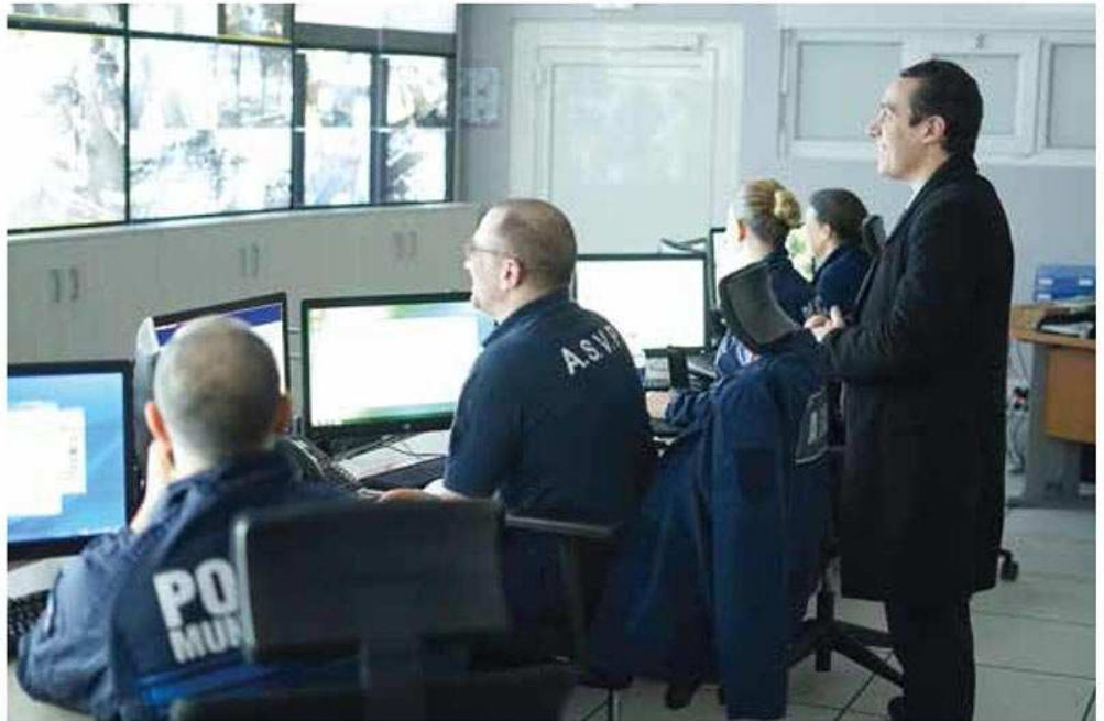
Une présence quotidienne des équipes de la ville.

L'autre avantage de cette collaboration environnementale et policière, outre une mutualisation des moyens, est une vigilance accrue des agents du service de propreté des zones non couvertes par la vidéosurveillance, les sites à l'abri des caméras étant moins nombreux qu'auparavant et donc inspectés plus régulièrement. Car un service de propreté efficace se doit de connaître la vie de son territoire à un niveau de détail assez fin, suffisamment en tous les cas pour être en mesure