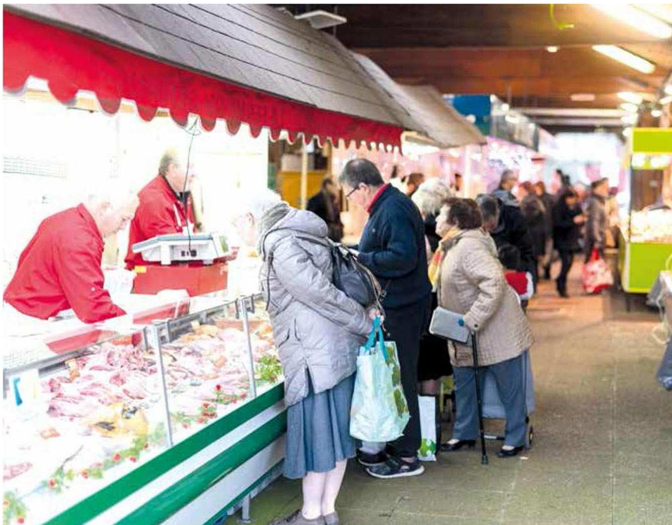
Un marché facteur de lien social.