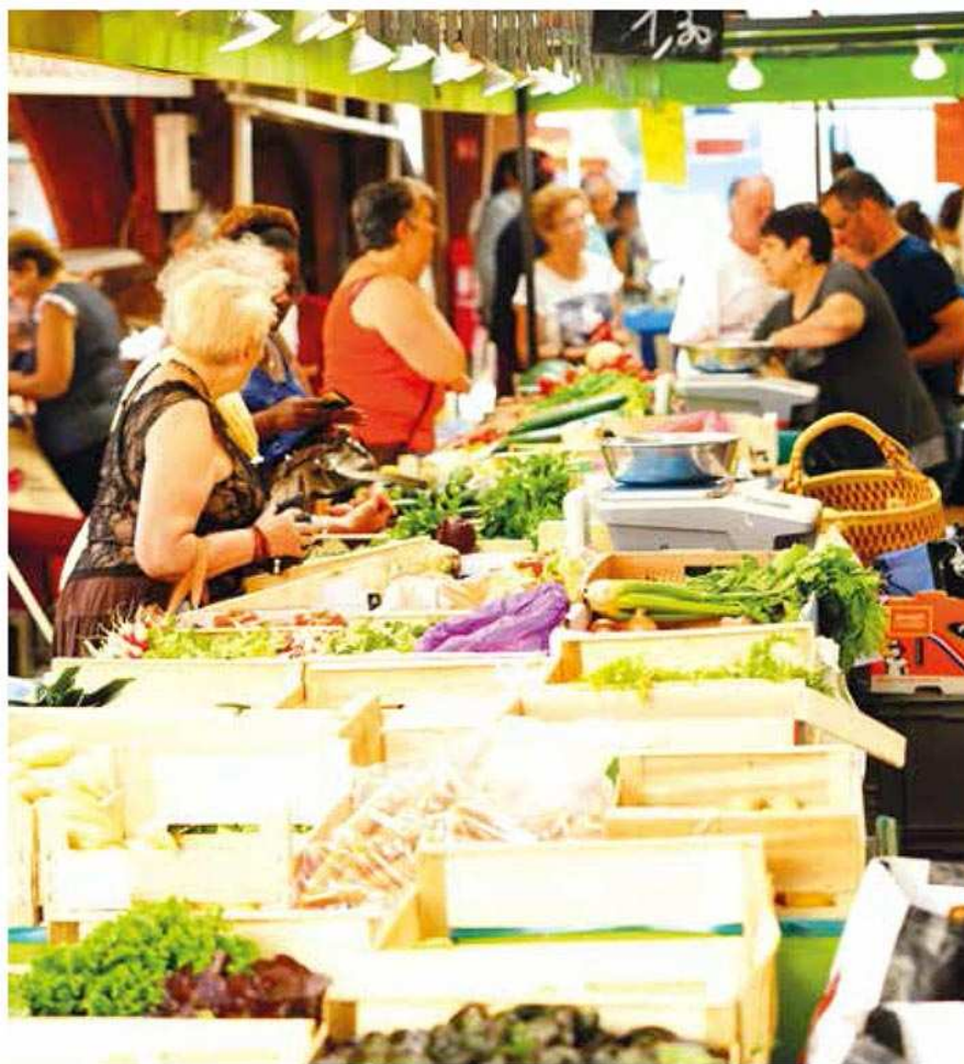
Un lieu de convivialité préservé.

Le marché Jacob dans sa nouvelle version de marché couvert est un marché dont l'offre répondra, comme il a toujours su le faire mais en plus confortable, aux besoins des 9 000 habitants de ce quartier résidentiel. Il s'insèrera parfaitement en le complétant au carrefour des 81 commerces de proximité (alimentation, services à la personne, habitat, culture-loisirs,