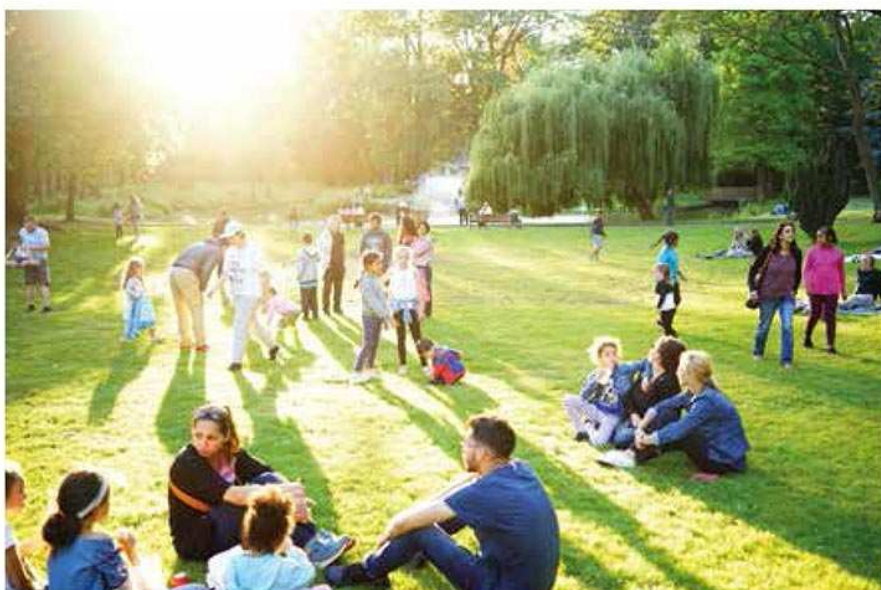
Dynamiser l'offre de loisirs.

faire bouger les lignes sans omettre de préserver les acquis d'un vivre ensemble reconnu et apprécié par les Livryens. Encore et toujours ce difficile équilibre, cette mixité entre les fonctions de commerce, les activités tertiaires, les logements et la circulation routière. Parmi les outils mis en place par la municipalité, il y a tout d'abord l'instauration de périmètres de préemption des fonds et baux commerciaux et artisanaux. C'est en effectuant une veille dédiée à ces territoires que se repèrent très en amont les changements en cours. Cela permet d'intervenir auprès des vendeurs et des acheteurs, et de mieux les guider vers les démarches visant à la réussite de leurs projets d'entreprise, que ce soit avec un accompagnement à la création d'entreprise, une mise en relation avec les chambres consulaires ou l'orientation vers des plateformes de soutien à la création d'activité commerciale.